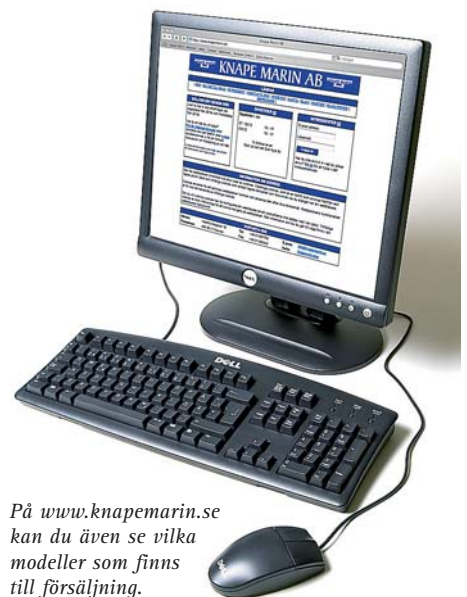
På www.knapemarins.se kan du även se vilka modeller som finns till försäljning.

– Båtar är absolut inte underhållsfria, tvärtom. Det är rätt märkligt att de flesta är nogga med service på bilen, men inte sällan glömmer båten. Vi märker ofta när någon lämnar in sin båt att underhållet är eftersatt. Men tack vare våra kontrollrutiner, och att varje båt besiktigas, upptäcks alltid sådant som är mindre bra. Och det är bra.