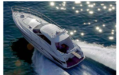
I sportiga Elan Power 35 har förare och passagerare rejält utrymme och är väl skyddade mot vådret.

Varje år säljer Knape Marin ett 50-tal nya båtar. Kunderna finns över hela Sverige och företaget erbjuder också finansiering via ett fler-