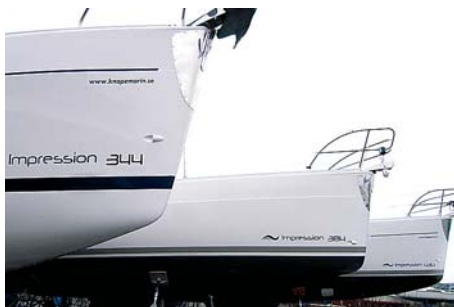
Knapemarins har försäljningsbryggor både på land och i sjön.