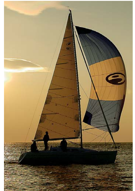
En meningsfull fritid – då handlar det om att segla!

Under sina många år i branschen, och som seglare, har Bo Knappe sett trender komma och gå. Något han sätter extra värde på är att köp av båt numera är en familjeangelägenhet: