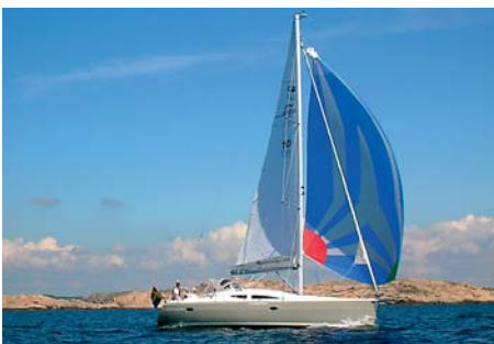
Impression, designad av Rob Humphrey, är lika lättseglad som vacker.

Knape Marin är återförsäljare av flera av de mest attraktiva segelbåtarna. Slovenska företaget Elan, som tillverkar drygt 400 båtar årligen, representeras med totalt nio modeller. Fem av dem, från 31 till 46 fot, bär namnet Elan men företaget tillverkar också båtar av märket